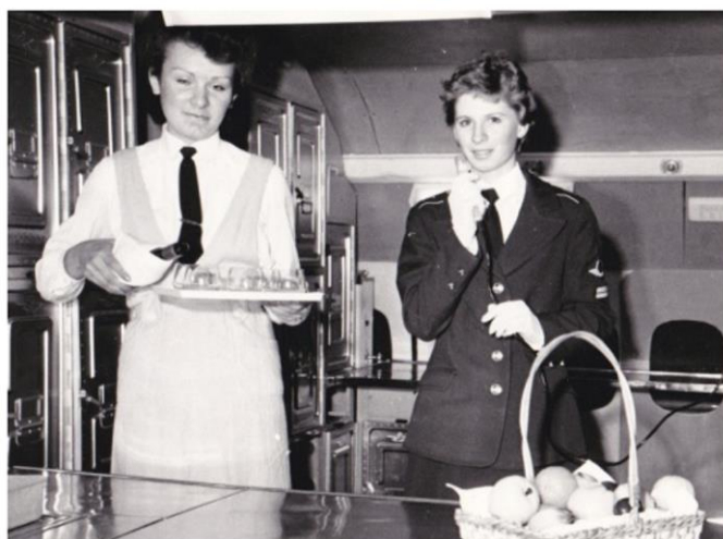
Будущие бортпроводники в процессе обучения

1976 год. Впервые в истории гражданской авиации СССР на базе ЛАТУ ГА началась подготовка бортпроводников.