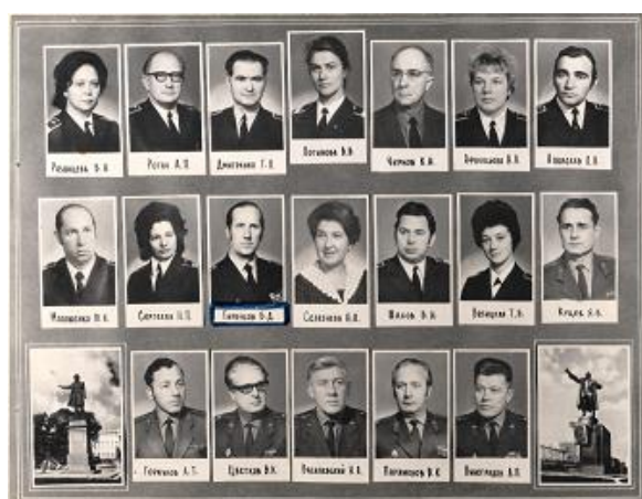
Педагогический состав Ленинградского авиационного технического училища гражданской авиации, фотография 1972 года

1976 год. Впервые в истории гражданской авиации СССР на базе ЛАТУ ГА началась подготовка бортпроводников.