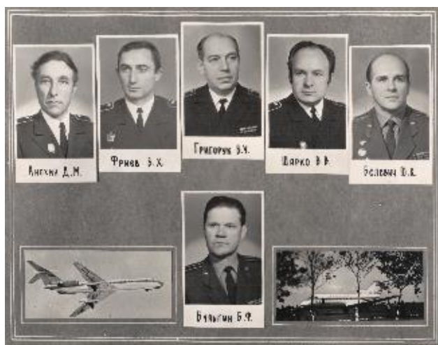
Руководители Ленинградского авиационного технического училища гражданской авиации, фотография 1972 года