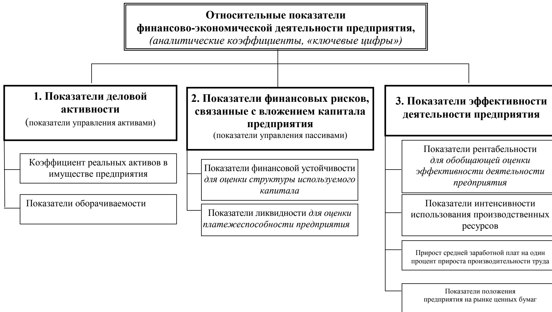
Рисунок 1 – Пример классификации относительных аналитических показателей финансово-хозяйственной деятельности предприятия