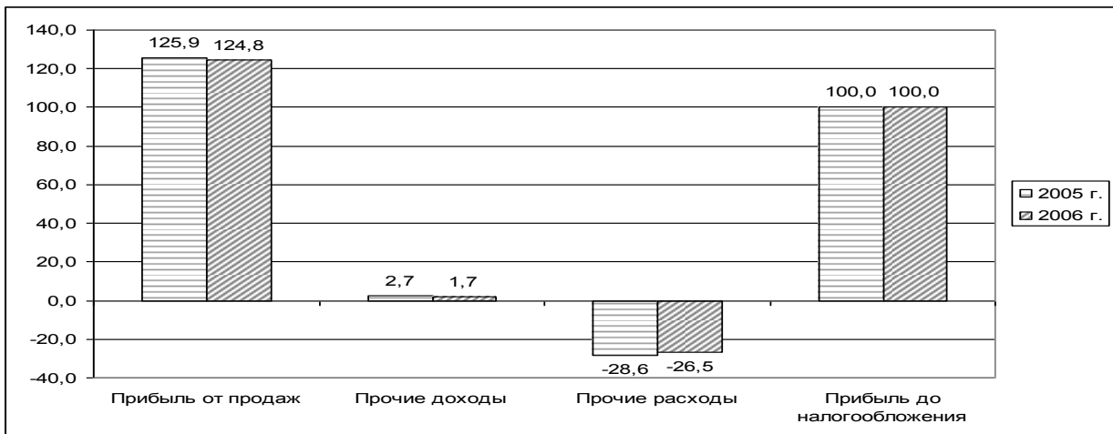
Рисунок У.3 – Диаграмма изменений в составе прибыли в 2005 и 2006 гг. ОАО «Волна».