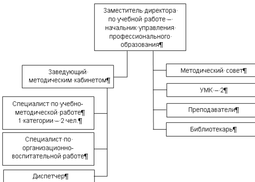
Рисунок 2 – Структура управления профессионального образования Хабаровского филиала им. Б.Г. Езерского СПбГУ ГА